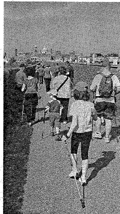
Grandi e piccini alla partenza di una passeggiata in città

l'innovativo progetto di diffusione dell'educazione motoria presente da 10 anni in tutta la provincia.