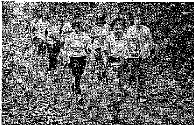
Un'immagine della prima camminata al Bosco Fontana l'anno scorso